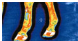
Nach 23 Minuten steigt die Temperatur. Die erhöhte Durchblutung des links abgebildeten Beines ist deutlich sichtbar.