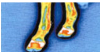
Beide Vorderbeine vor der Anwendung mit Veterinary Liniment